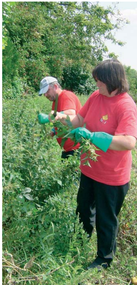
A Bio Cambrésis, association d'insertion qui fabrique des soupes, les orties sauvages du jardin sont cueillies à la main.

Et puis il y a les bouillons. Chez Rapunzel par exemple, le bouillon de légumes est non seulement en cube, mais aussi en poudre. On y met juste