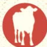
Fromages de vache

De manière générale, il est conseillé de marier les fromages et les vins d'un même terroir.