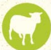
Fromages de brebis