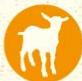
Fromages de chèvre